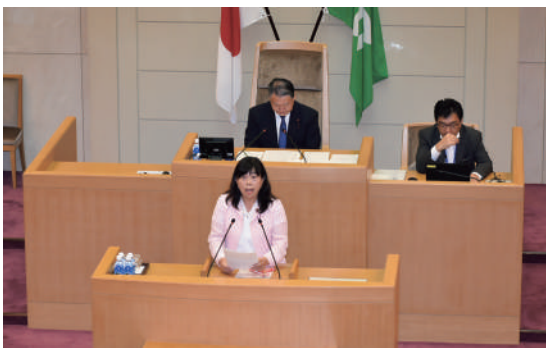
2025年10月10日 本会議場にて一般質問