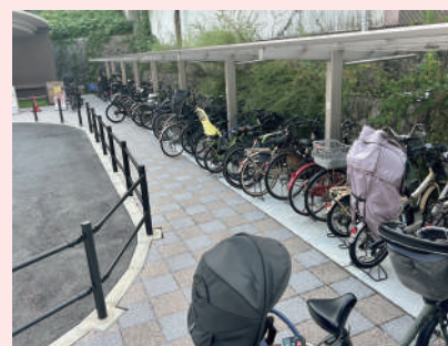
大池駅の駐輪場の現状