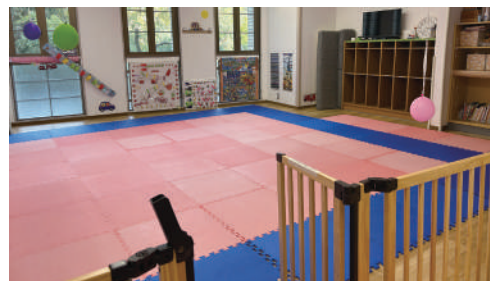
一時保育も無料で利用できます!