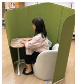
集中して仕事に取り組んだり、情報交換することもできます