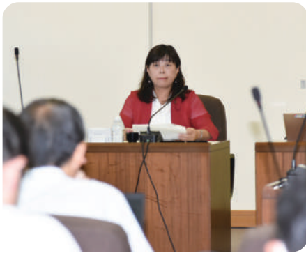
建設防災委員会の議事進行をしています！

おいしく安全な水道水の提供、公園や道路・下水道の整備、街灯や防犯カメラで地域の安全を守り、市民のみなさまの命を守る分野の常任委員会です。来年2025年には阪神淡路大震災から30年を迎えます。南海トラフ地震や様々な災害に備える力強いまちづくりを推進します！