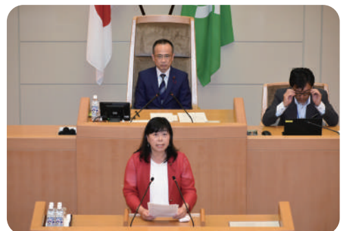
R6.5.29 市長に質問しました！