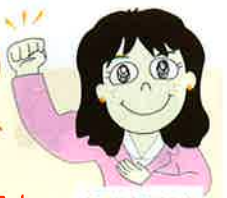
伊藤めぐみブログ