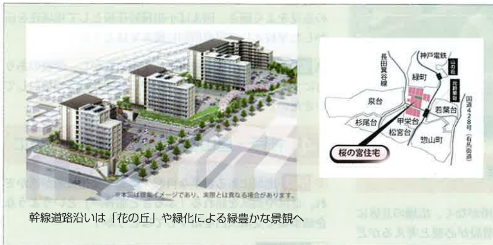
幹線道路沿いは「花の丘」や緑化による緑豊かな景観へ

フリー動線も確保 されます。また市営住宅内には若年・子育て世帯向けの住戸タイプも確保されます。今後、入居者の方への説明会、仮移転、建設工事と進みますが、 安全に工期も短縮して実施されていくことが大切です 。また、建替えに伴う余剰地には戸建住宅地として、 若年ファミリー世代の入居が期待 されます。