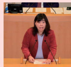
本会議で、提案議員を代表して 主旨を説明しました 2024/12/4

学校現場では教員希望者の減少、病気退職者や、早期退職者の増加などで、クラス担任が不在になるなど、深刻な教職員不足となっています。今後もこの状況が続いていくと、持続可能な学校が成り立たなくなる懸念があります。給特法(『公立の義務教育諸学校等の教育職員の給与等に関する特別措置法』)が適用される教員の、長時間労働が是正され処遇改善されるよう、多くの議員の賛同をいただき、神戸市会から国への意見書が提出されました。