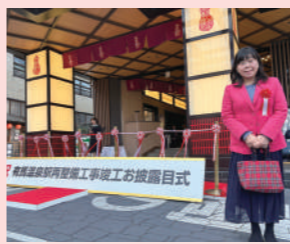
有馬温泉駅再整備工事竣工お披露目式へ お披露目式へ 2025/2/6

4月の神戸空港国際化も間近な2月6日、和の雰囲気にあふれた有馬温泉駅のリニューアル工事が完成しました!国内外から多くの観光客が訪れ、ますますにぎわうまちづくりのため、環境整備を継続していきます。六甲山や有馬三山の森林浴や登山も楽しんでいただき、有馬温泉のお風呂に入ってさらに元気になっていただけたらうれしいですね。