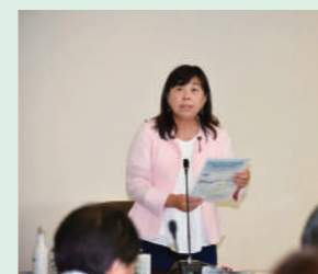
令和6年度 決算局別審査で 建設局に質疑 2024/10/2

新神戸トンネルを出て右折した小橋(こはし)付近から日の峰5丁目交差点付近までの間、約1kmにおいて、トンネルによるバイパス整備を行っています。この区間にある青葉台から箕谷小学校へ通う子どもたちの通学路の安全確保についても非常に重要ですので、対策を求めました。また、地元の下谷上自治会からも要望がある、片道1車線の「小橋交差点」では右折する車が停車するため車列が発生し、せっかく新しいトンネルが出来ても、その手前で渋滞してしまうことが想定されます。