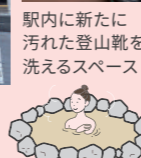
駅内に新たに 汚れた登山靴を 洗えるスペース