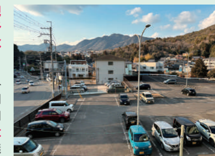
箕谷駐車場跡地に、2つ目の北建設事務所が建設されます! ※3/14で駐車場は営業終了