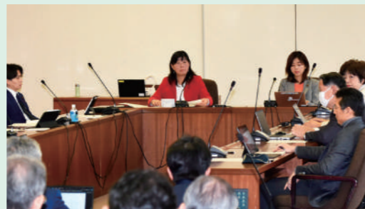
委員長として委員会運営をしています 2025/2/19

今年度は、建設防災委員会で委員長を拝命し、建設局・水道局・消防局・危機管理室の所管事項を中心に取り組んでいます。お住まいの地域で「街路樹が繁茂して防犯面で不安」「地域の配水や漏水のこと」「防犯カメラを設置してほしい」「街灯を設置してほしい」など、お困りごとのお声を取り上げて改善に取り組んでいます!