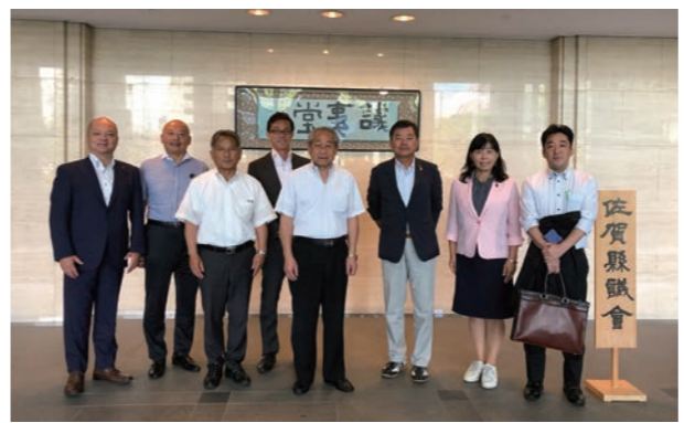
▲会派で教育ICT先進都市である佐賀県を視察

また、外郭団体に関する特別委員会にも所属し、神戸市が25%以上出資している32の団体について、事業効果の審査をしています。例えば六甲山牧場や神戸ワインなどの『神戸みのりの公社』、観光事業に特化した『神戸観光局』『神戸市道路公社』など、神戸市民のみなさんにとって重要な団体の審査をしています。